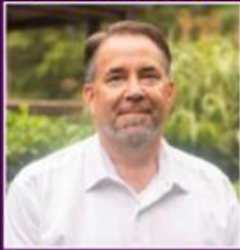
Stephen Dalina Monroe Mayor